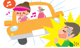
仕事中・スポーツ中・交通事故や 走行中のケガ