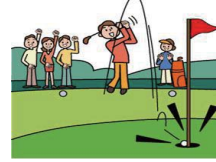
ホールインワン・ アルバトロス費用