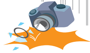
カメラを落として壊した