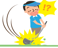
ゴルフクラブの破損